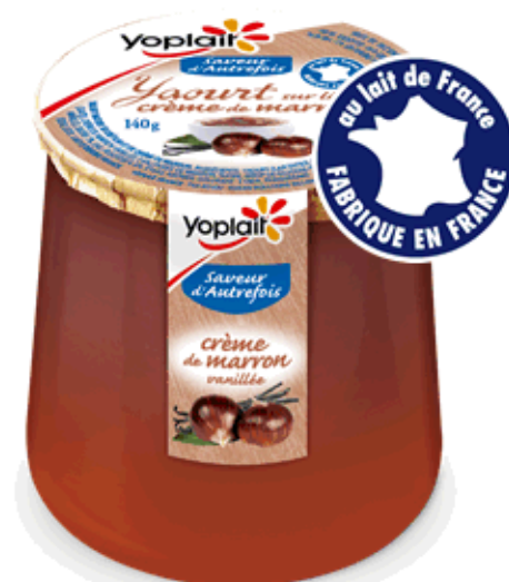
GEM RCN *: Fréquence libre